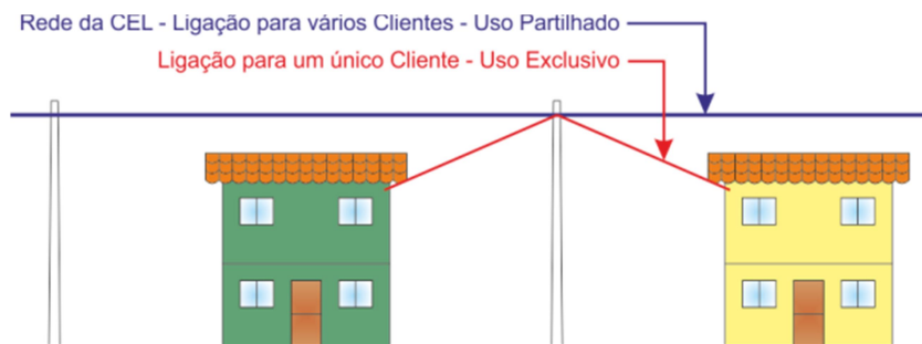
Figura 1 – Exemplo de uso exclusivo e uso partilhado em rede aérea

Exemplos gráficos para melhor entendimento.