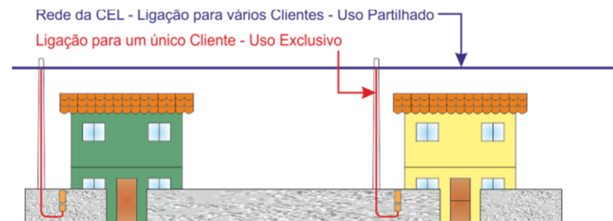
Figura 2 – Exemplo de uso exclusivo e uso partilhado em rede aérea/subterrânea